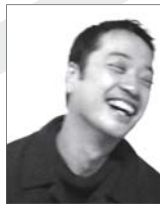
講師 太田浩史 おおた・ひろし

1941年生まれ。1965年東京大学工学部建築学科卒業。日本建築学会賞作品賞、ヴェネツィア・ビエンナーレ「金獅子賞」、王立英国建築家協会(RIBA)ロイヤルゴールドメダル、ブリッカー建築賞など受賞。