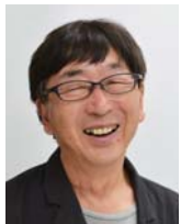
講師 伊東豊雄 いとう・とよお

14:50~15:50 後半発表 15:50~16:00 休憩 16:00~16:30 表彰式、総評