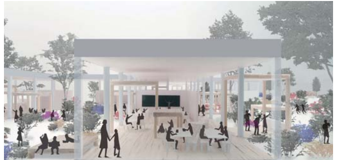
宮城県七ヶ浜中学校建て替えプロジェクト