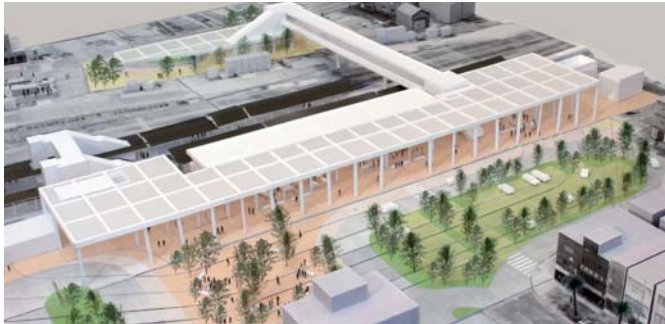
宮城県延岡駅周辺整備プロジェクト

宮城県延岡市における「駅からはじまるまちづくり」を掲げた延岡駅周辺整備のデザイン監修者として、地方都市における新しいまちづくりを模索する建築家の乾久美子氏。また現在進行中のもうひとつのプロジェクト、宮城県の七ヶ浜中学校の建て替えでは、建築と自然の新たな関係づくりを提案しています。今治市伊東豊雄建築ミュージアム・建築セミナーでは、開催中のヴェネチア・ビエンナーレ国際建築展で伊東豊雄とともに「みんなの家」を発表している乾氏を講師に迎え、地域と建築の新しい関係性について語り合います。